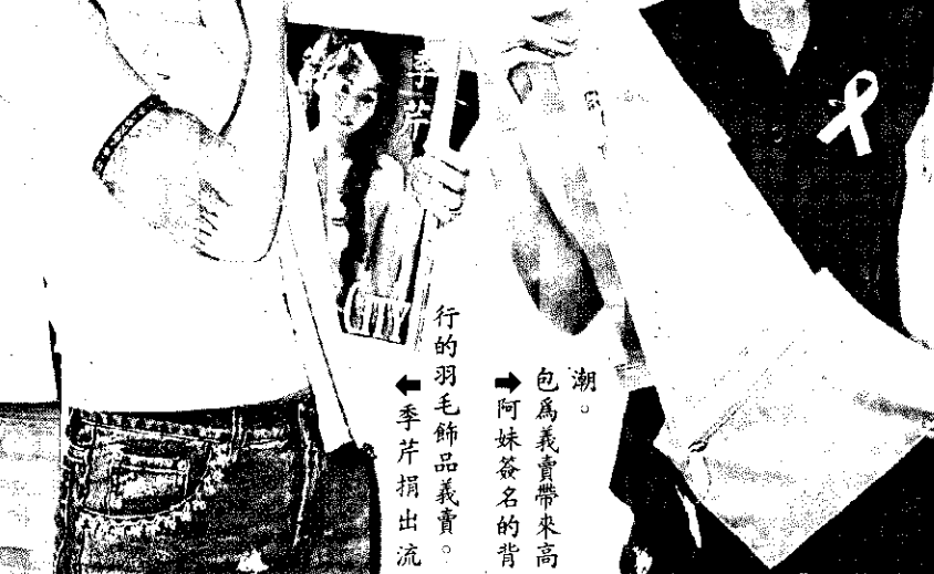
包為義賣帶來高潮，阿妹簽名的包包，手片捐出流。

張惠妹雖然無法出席明星賑災二手衣演唱會，但也心意十足的為羅東聖母醫院製作的背包與帽子簽名，在會場上由其他藝人代賣，亦募得好價錢。 近一、兩個月都將心思、體力放在個人演唱會，張惠妹對於這次台灣大地震，雖然無法立即投入賑災行列，但也率先捐出了她新加坡演唱會約一百二十萬的酬勞，明星賑災二手衣義賣會，阿妹在香港出席「傳心傳意大行動」，因此希望簽名的帽子與包包，能變得更有意義，並呼籲大家的賑災行動可以一直到幫助災民完成重建家園。