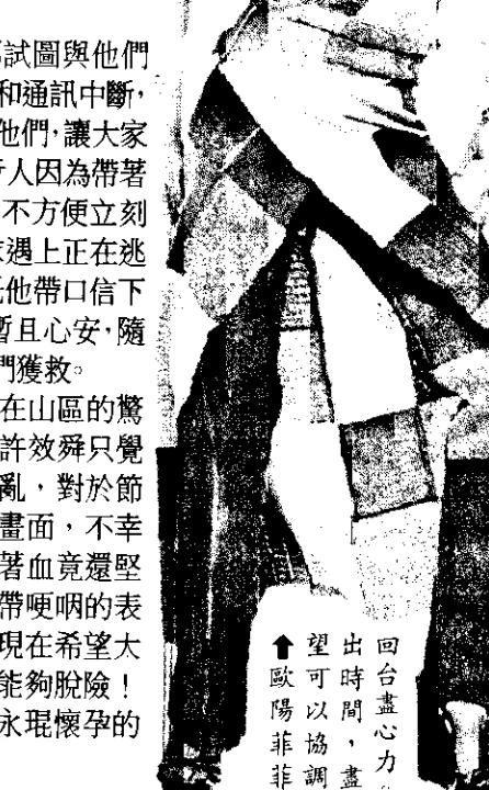
台協助賑災。

★不少人在海外的藝人得知台灣大地震後，紛紛表達關懷之意，並都期望可以抽空回台參與賑災、募款活動。 正在美國準備全新英文專輯的李玟，從CNN得知消息後，淚流不止地馬上和台灣工作人員連絡，並拋磚引玉地捐出一百萬元。另外她十分關心家住在南投、台中等地歌迷的安危，她表示，自己試著聯絡住在當地的歌迷，卻都無法成功，令她十分憂心。 人在北京的劉德華，自得知消息後，就不停打電話到台灣關心狀況，而他目前正在努力協調通告時間，希望可以第一時間來台盡一分力，並希望大家勇敢面對，明天一定會越來越好。 長期旅居日本的歐陽菲菲，看到新聞嚇得一身冷汗，也讓她回想起四年前阪神地震的慘況，所以她特別打電話到上華唱片表示慰問之意，並表示只要時間許可，她會迅速返台幫忙。 今天出發到加拿大拍攝旅遊專輯的翁虹，因通告纏身，無法來台表達心意，讓她甚感遺憾，不過她強調，只要這項通告一結束，她希望可以馬上來台幫忙。 才剛離台的日本當紅樂團彩虹，對於轉眼間台灣發生地震後的慘況表示，一時之間很難接受。來台的hyde和tetsu特別透過E-Mail表達慰問之意，信函上兩人表示，希望台灣人民可以盡快度過這一段黑暗時期，早日重建家園。 韓國團體酷龍，深深感受台灣觀眾的熱情，所以從新聞一得知地震消息後，立刻傳真到滾石電星唱片表達關懷之意，傳真上也表示如有任何需要請讓他們知道，他們將排除萬難來台盡一分力。