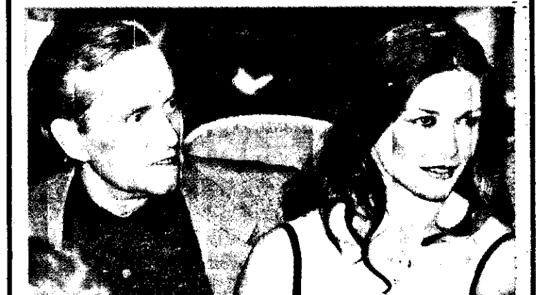
★(上圖)網球名將阿格西(左)與男星凱文科斯納十八日在賭城觀賞拳擊錦標賽時寒暄致意。法新社/張士達譯 (下圖)麥克道格拉斯(左)與未婚妻凱薩琳麗塔塔斯十八日在賭城觀賞拳擊錦標賽。道格拉斯和塔斯計畫在本月下旬公開宣佈他們的婚約。法新社/張士達譯

記者 洪敏祥 / 報導 ★在攝影師和造型設計師的眼中，林熙蕾是屬於神秘色彩的性感女郎，這是和陽光四射的性感女星的所不同的特色。 在媒體攝影有豐富經歷，現在是蜚揚攝影棚攝影師的曾敬福，鏡頭下閱歷過中外明星，從林熙蕾出道到目前成為性感明星的偶像，他解析「眼神」和「嘴唇」是她最有魅力的地方。「林熙蕾的身材比例並不突出」曾敬福說；但她的性感魅力