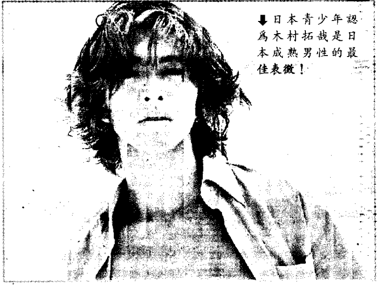
日本青少年認為木村拓哉是日本文成成熟男性的最佳表徵！

草彥剛溫柔對待的攻勢。 除了木村拓哉、中居正廣、草彥剛，「彩虹」樂團主唱 Hyde、Glay 吉他手 Jiro 也成為這次魅力男性的三、四名，由於前五位魅力男性都出自合唱團體，似乎能歌、擅舞的男性特別能和日本青少年產生共鳴。