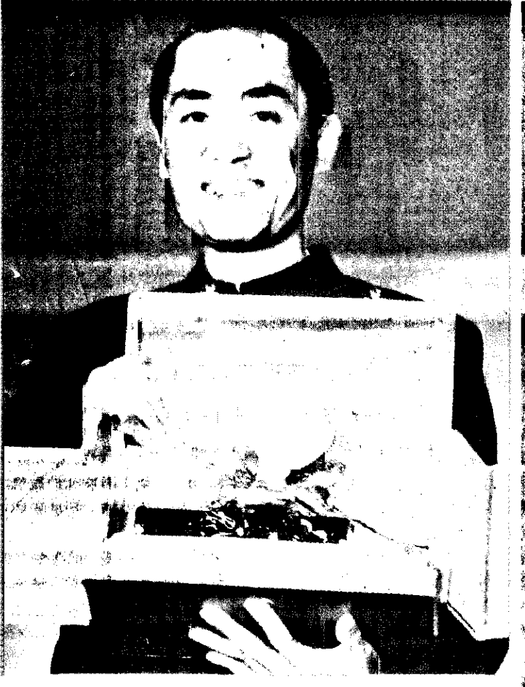
南非導演馬拉奇以「一個溺斃年輕人的畫像」獲得最佳短片銀獅獎。張士達譯