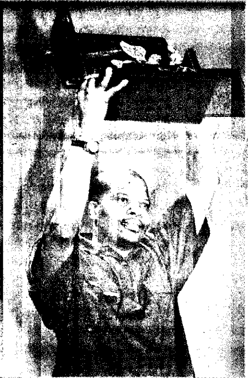
中國導演張藝謀以「一個都不能少」榮獲威尼斯影展最高榮譽金獅獎。 法新社/張士達譯