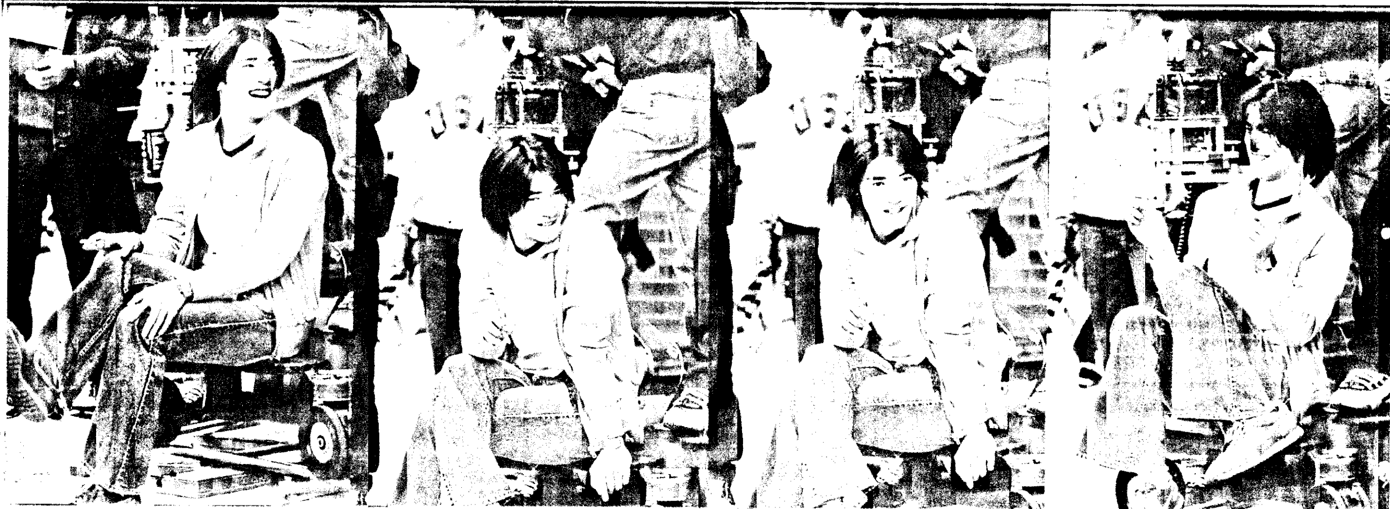
↑金城武的魅力 風靡無數影迷。