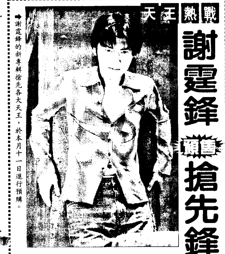
謝霆鋒的新專輯搶先各大天王，於本月十一日進行預購。

記者 邱素惠、劉玄寧 / 報導 ★陶晶瑩「我變了」專輯推出，真的見到陶子變了，在「離開我」MTV 拍攝中，一向堅強開朗的陶子，真的哭了，在北京擔任駐地記者的張翰，還受邀回擔任男主角。 歌壇重新定位，陶子的新歌很快的被傳唱開來，專輯的製作好評不斷，身分多重的她，拍 MTV 的時間都是犧牲睡眠才完成的，「離開我」在凌晨兩點出發，到宜蘭一處小學取景，陶子立刻想起宜蘭好吃的海鮮，在辛苦的工作之後，小燕姐特地下令一定要吃過海鮮才可打道回府，讓陶子樂不可支，也可見小燕姐愛才心切。 張翰在 MTV 中飾演聽障畫家，有趣的是，劇情中他送給陶子的一幅畫，可是出自陶子的創作，而陶子在這首凄美歌曲的情境中，回到刻骨銘心的情緒中，真的落淚了。 哈囉 Kitty 狂熱份子「照過來!!中廣流行網「美的世界」將於九月二十五日舉辦「kitty 通廣播大賽」，代言人陶晶瑩號召全國凱蒂貓通來一較高下。 日本有「電視冠軍」，中廣流行網「美的世界」有「廣播冠軍」，自六月份起陸續舉行過「便利商店通」、「電影通」、「KTV 通」，收到聽眾熱烈迴響，九月再接再勵舉行「Kitty 通」，有請陶晶瑩廣發武林帖，邀集各方高手一起競逐，時間在本月二十五日上午十點至十二點。報名專線(02) 2367-7679 分機 311 或 316。