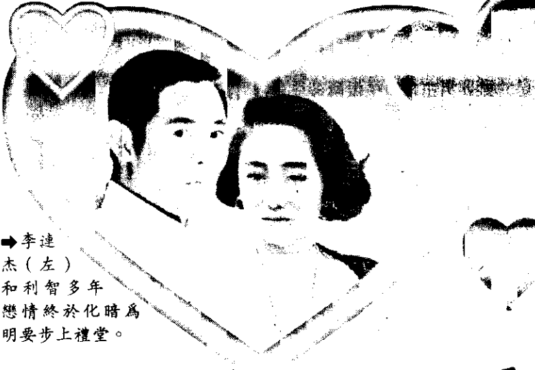
李連杰(左)和利智多年戀情終於化為明要步上禮堂。