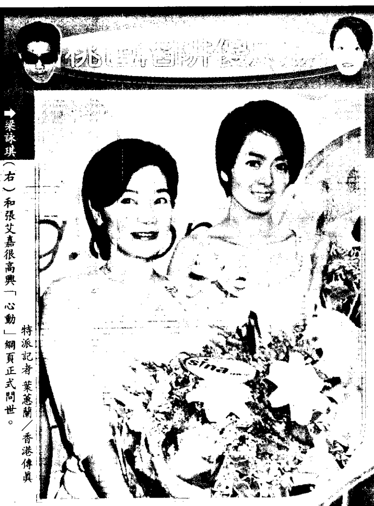
梁詠琪(右)和張艾嘉很高興「心動」網頁正式開張。