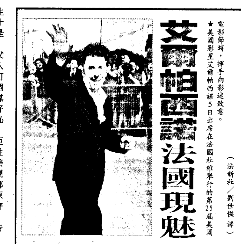
電影節時，揮手向影迷致意。★美國影星艾爾帕西諾5日出席在法國社維舉行的第25屆美國艾爾帕西諾法國現魅

記者 劉世傑／報導 ★麥可！麥可！你的老毛病又犯了！美國 Star 雜誌的攝影記者，日前在紐約曼哈頓開拍時，意外撞見天王巨星麥可傑克森帶著一名小男生，手上拎了大包小包新買的玩具。麥可傑克森被發現，趕忙用禮品盒擋住小男生的臉。 據該名攝影記者表示，麥可當時很緊張，不願意讓小男生的容貌曝光。那他當時可是奮不顧身，不在乎自己已被拍到囉？倒也不。麥可頭上蒙著一條藍色的絲巾，眼睛全被太陽眼鏡遮住，渾身包得密不透風，活像是阿拉伯王子。 他一見攝影記者舉起相機，就死命把男童推入他的豪華禮車。從身高判斷，該名男童大約只有十一、二歲。 經查證瞭解，麥可買給小男生的諸多玩具中，有一項價值六十美元的「星際大戰」面具，也是用來遮掩容貌的。 美國媒體質疑，是哪一家的父母，會放任自己的小男生一個人在曼哈頓高級區遊蕩，或是不可思議地將孩子託管給麥可，一個曾經涉嫌性騷擾男童的男人？媒體甚至出言大罵，麥可是該好好遮住自己的臉，因為實在太羞恥了。 這位無法讓人安心的天王巨星，在一九九四年面臨一項「性騷擾」指控，後來花了四千萬美金才把原告擺平，然後他對電視台記者強調，這一切指控「全都是謊言！謊言！謊言！」後來原告男童的父親，認為麥可未遵守「不再對外談論此案」的協議，在盛怒之下，再次向法院提出告訴。