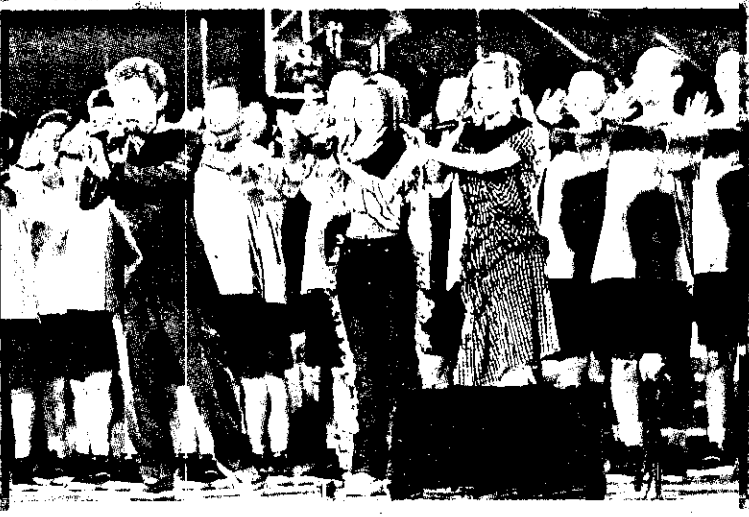
扶輪社會員們與表演藝人一起帶動現場氣氛。