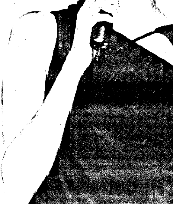
昨晚中正紀念堂廣場很「星報(爆)」!