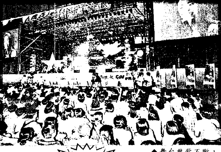
舞台熱歌不斷，台下掌聲不歇。