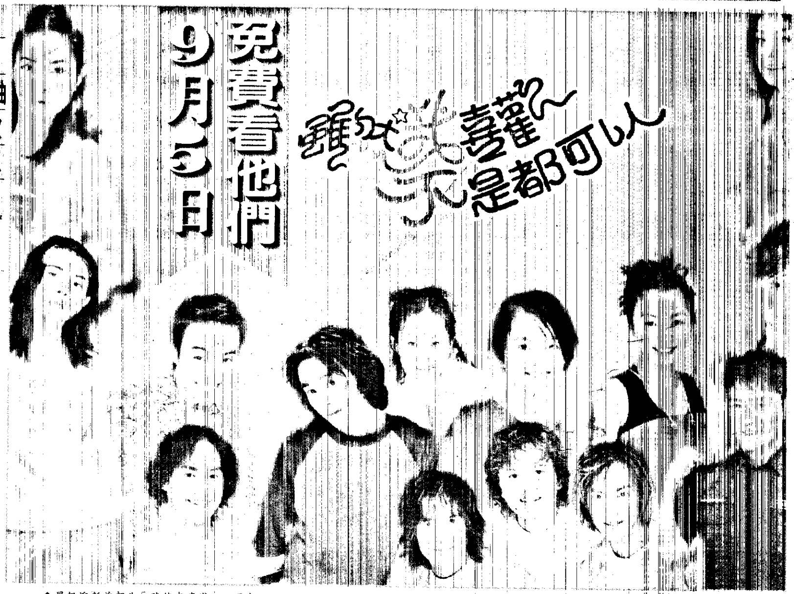
會星報迎新首歌曲「雖然我喜歡，不是都可以」大型晚會，群星與讀者有約。

時間：9/5晚上七點 地點：中正紀念堂 青春導彈：星報迎新首歌曲 發射指令：雖然我喜歡 不是都可以 引爆下場