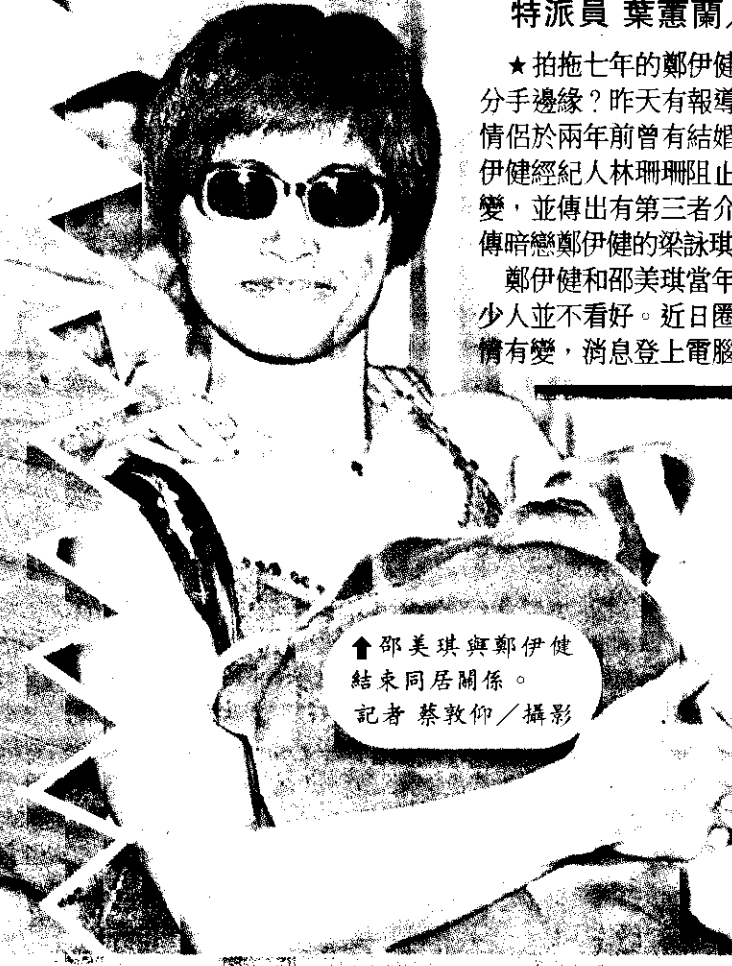
邵美琪與鄭伊健 結束同居關係。