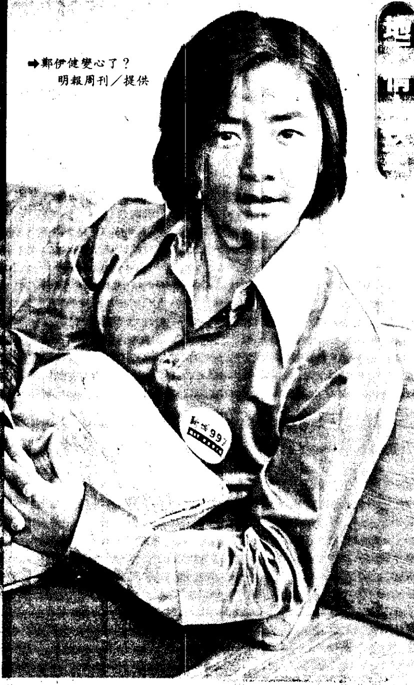
鄭伊健變心了？