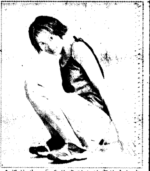
梁詠琪：「為什麼別人的事總會把我扯進去？」