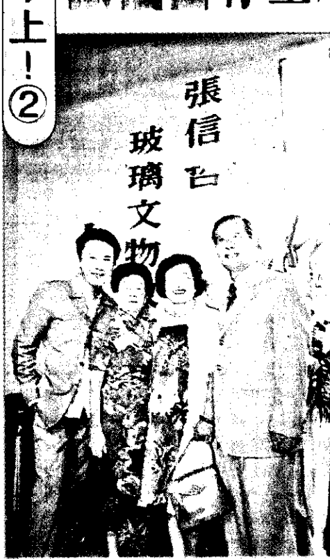
張信哲(左一)全家共同參與展覽。