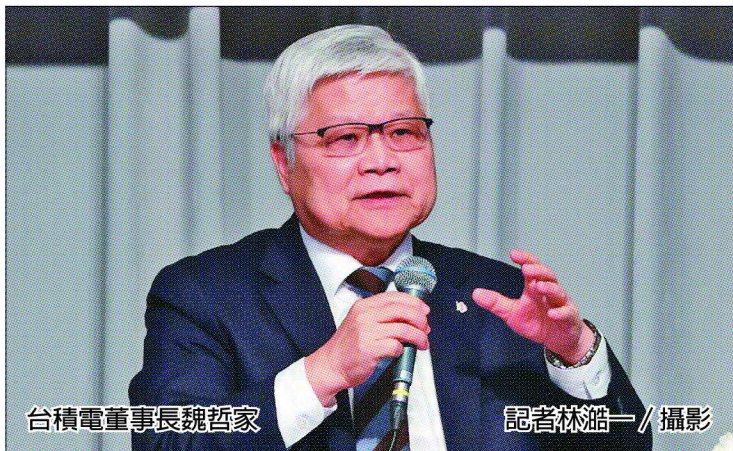
台積電董事長魏哲家

記者尹慧中、鍾惠玲／台北報導 台積電董事長魏哲家昨(18)日在法說會上表示，看到客戶更強的需求，看好本季美元營收可望續寫新猷，季增率可達7.5%至11.4%，毛利率高標更衝上55.5%，營益率同步揚升，同時上調全年業績成長幅度與資本支出下緣預測，「今年是強勁成長的一年」。