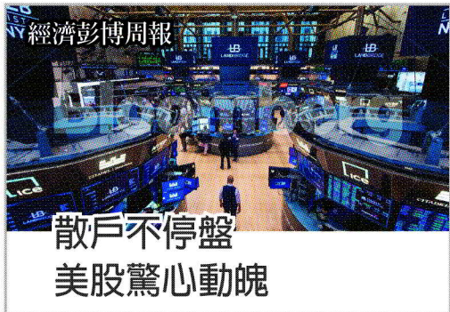
散戶不停盤 美股驚心動魄