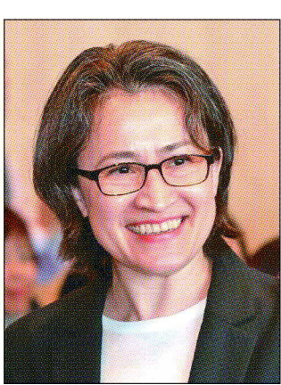
蕭副總統將出席17日創新論壇。

【本報記者余弦妙／台北報導】全球智慧化時代已經來臨，台灣正好在全球供應鏈中扮演關鍵角色，因此，賴總統在就職演說中提出「國家希望工程」、發展五大信賴產業，政府將持續落實賴總統政見，投資未來世代，並打造智慧永續的新台灣。經濟日報將於17日在台大醫院國際會議中心舉辦2024創新論壇，以「智慧驅動 點亮永續之島」為主題，邀請各界專家探討如何透過快速發展的AI等新科技，賦能永續。本論壇由經濟日報、遠傳電信主辦，協辦單位為中