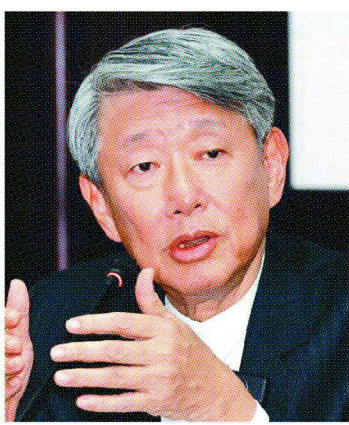
經濟部長郭智輝

經濟部長郭智輝昨(30)日表示，核三停機後將不影響供電，他同時表態，核三廠可作為2027年、2028年、2029年AI爆發性成長時的備援電力，這也是因應AI用電成長的解方之一。