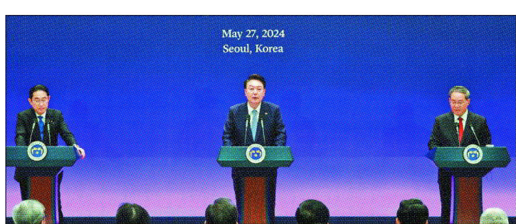
日本首相岸田文雄(左起)、南韓總統尹錫悅、大陸國務院總理李強昨日在首爾舉行峰會，同意加速推動FTA。

日本首相岸田文雄、南韓總統尹錫悅、大陸國務院總理李強昨天上午在首爾共同出席第九次中日韓領導人峰會，會後舉行聯合記者會並發表聯合宣言及合作聲明。聯合聲明中，三位領導人同意透過定期舉行三邊峰會和部長級會議，將三方的合作「制度化」。他們並表示將繼續加速協