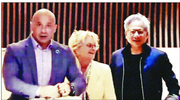
輝達執行長黃仁勳(右)與夫人Lori Huang(中)昨晚搭乘專機抵台。

【記者蕭君暉、尹慧中、林蕙茹/台北報導】台北國際電腦展(COMPUTEX 2024)將在6月4日至7日開展，輝達(NVIDIA)執行長黃仁勳昨(26)日提前抵台。