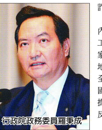
行政院政務委員羅秉成

經濟日報與第一金控將於4月10日共同主辦「誠信金融論壇-防詐阻騙 打造安全金融」，邀請產、官、學共同探討如何打造金融安全網，針對高齡、弱勢、及年輕族