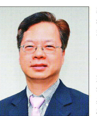
國發會主委龔明鑫 (本報系資料庫)

【記者葉卉軒 / 台北報導】國發會主委龔明鑫表示，隨出口及投資動能回升，今年我國經濟成長率可望逾3%，國發會將聚焦「淨零與氣候變遷」、「亞洲矽谷3.0」、「人口及攬才政策」三大重點政策方向，協助產業強化韌性並重塑企業價值。 經濟日報與資誠聯合會計師事務所將於3月27日共同舉辦「2024臺灣企業領袖關鍵趨勢論壇」，探討企業如何強化韌性，打造永續未來。龔明鑫將出席，並以《企業重塑-強化產業韌性重塑企業價值》為題發表演講。 龔明鑫表示，為達淨零目標，且因應國際如歐盟推動「碳邊境調整機制」(CBAM) 等碳關稅趨勢，政府將穩健推動碳定價，激勵企業減碳，創造低碳新商機；同時也與經濟部合作提出「綠電購電契約保證」搭配「剩餘綠電流通轉售機制」，協助企業採購綠電、加速再生能源推動，並帶動產業鏈連鎖效應。 龔明鑫指出，因應氣候變遷調適行動計畫(2023-2026年)，國發會亦將協助製造