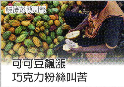
可可豆飆漲 巧克力粉絲叫苦

中華民國113年3月11日 星期一 農曆甲辰年2月2日 第20694號 經濟日報網 money.udn.com