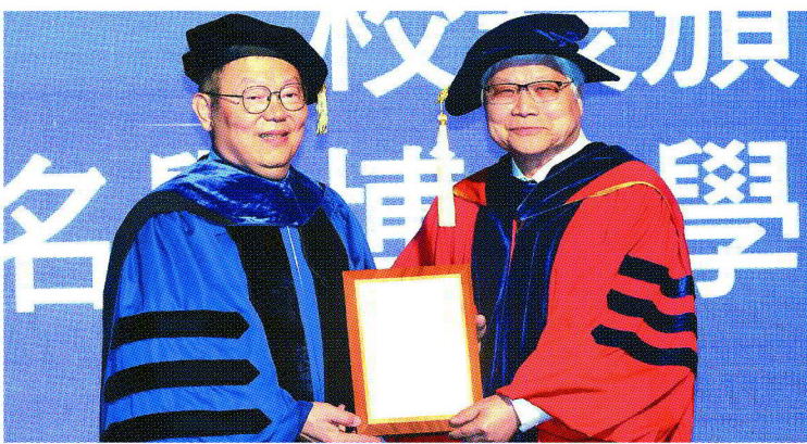
台積電總裁魏哲家(右)獲國立陽明交通大學校長林奇宏頒授「名譽博士」學位。

第一志願當醫生，但不敢看到血，「人要知道自己什麼會做、什麼不會做」；第二志願他評估建築，又覺得自己沒有天分，只好選擇讀電機。透過自我觀察，魏哲家找出自己天分所在，最終獲得美國耶魯大學取得電機工程博士學位，「我念博士時，知道自己腦袋沒有那麼強，但我很喜歡工程，所以就進工業界」。魏哲