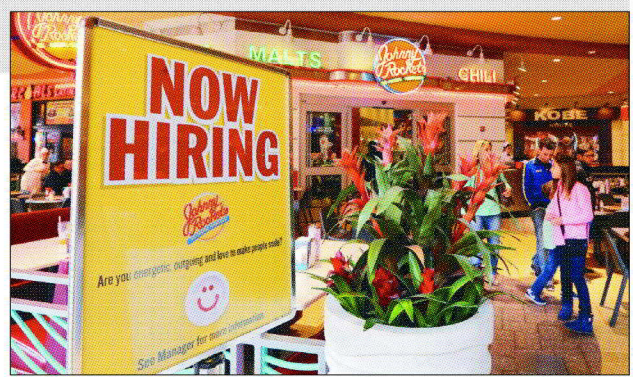
美國1月非農就業人數激增35.3萬人，超強的就業表現，降低了市場對3月降息的預期。

上月的就業成長，主要集中在健康照護、專業與商業服務，以及零售交易等領域。彭博資訊報導，強勁的就業報告也解釋了美國消費支出何以保持強勁，並讓美國經濟持續走在擴張的路上。