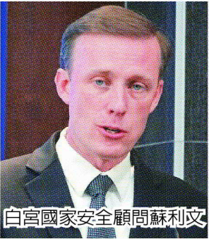
白宮國家安全顧問蘇利文

蘇利文藉機強調密集外交的重要性，他說，台灣幾周前在未爆發重大兩岸事件狀態下舉行選舉，因為華府、北京和台北三方面都針對彼此意圖，設法