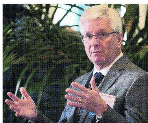
Fed理事沃勒表示，美國沒必要「急著」降息。

【編譯劉忠勇、任中原／綜合外電】美國聯準會(Fed)去年11月率先釋出「轉鴿」訊號的鷹派理事沃勒16日表示，美國通膨率距離2%目標已「近在咫尺」，但沒必要「急著」降息，應先確認通膨會持續下滑。這番談話進一步降低市場對於3月降息的預期，全球股市應聲挫跌，華爾街「恐慌指數」升至2個月高點。