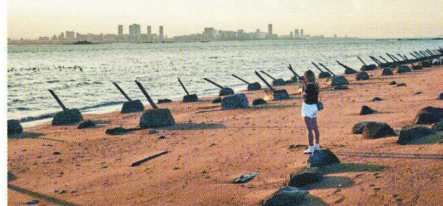
彭博經濟學家估計，台海若開戰，全球將付出約10兆美元代價。圖為金門海灘反登陸樁的遺跡。

本和其他東亞經濟體受到最大影響。 除了台海開戰的情境，彭博也模擬中國大陸對台灣實施一年封鎖對全球經濟的影響，台灣第一年的GDP將下降12.2%，中國大陸將萎縮8.9%，美國下滑3.3%，全世界減少5%。 13日的選舉結果雖不會立即引發危機，仍將界定兩岸關係走向。美國官員表示，中國可能計劃對選舉結果作出多管齊下的反應，包括軍事侵略、經濟