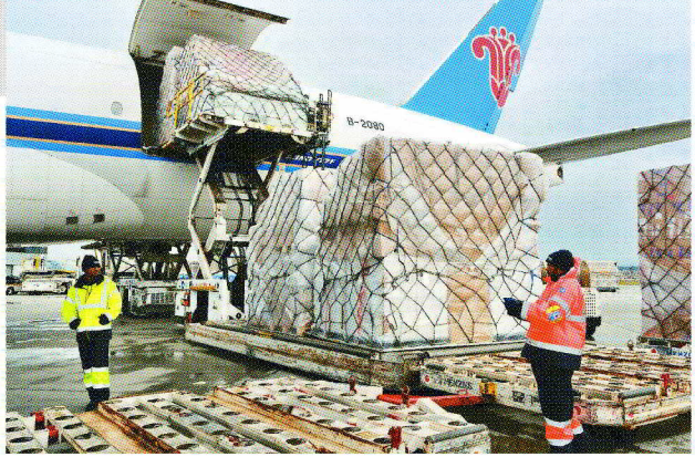
美國宣布延長對中國大陸進口產品301條款豁免期限五個月。

從這份對美加徵關稅商品第13次排除延期清單來看，附件中共有95個稅則號。包括飛機自動駕駛系統的零件、基因測序儀、潤滑油、潤滑脂、北美硬闊葉木原木、部分小蝦及對蝦種苗、潤滑油、木材、機械及醫用產品等。