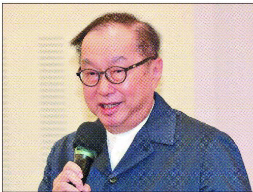
廣達董事長林百里強調一直看好AI，應用面無可限量，請大家不要太過擔心。

象。外界擔心概念股是否會一路崩跌，他認為，就跟心電圖同樣的道理，不管起起伏伏，最終只要是好的、健康的走勢，就不用擔心。