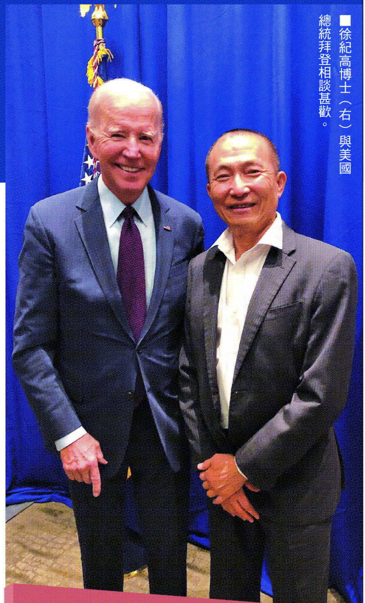
徐紀高博士(右)與美國總統拜登相談甚歡。