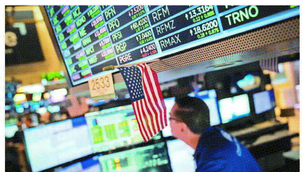
AI熱潮帶動下，費城半導體指數上周五連續二日大漲超過6%，美股三大指數也連漲二日。

台積電ADR前一個交易日飆漲12%後，上周五再漲2.2%，費城半導體指數更大漲6.3%，周線分別大漲11.9%和10.7%。邁威爾科技(Marvell Technology)預告AI事業營收下個年度將翻倍，股價漲32%