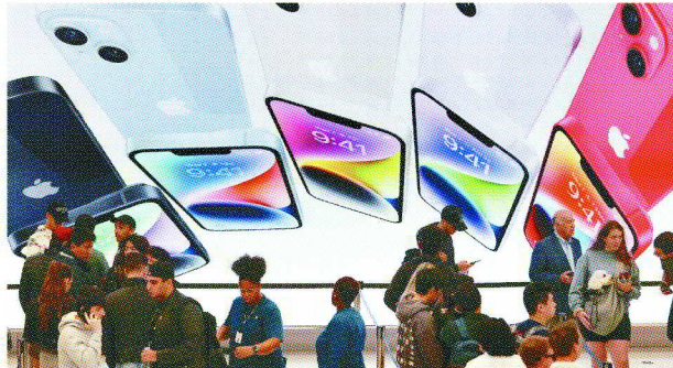
蘋果上季財報優於預期，主要因iPhone銷售比市場預期還強勁。

【編譯季晶晶 / 綜合外電】蘋果上季營收和獲利都均優於華爾街預期，主要得力於iPhone在新興市場的需求強勁，亞太地區與印度都是亮點，顯示在經濟高度不確定之際，蘋果仍保有韌性。蘋果預期本季營收看減約3%，但在電子產品景氣慘淡之際，iPhone逆勢成長已足夠振奮投資人，股價5日早盤大漲近5%。 在截至4月1日的年度第2季（上季），蘋果淨利年減3.4%至242億美元，每股盈餘1.52美元，營收年減2.5%至948.4億美元，是連續第二季下降，但優於分析師預測，減幅也比蘋果自己預估的約5%還小。財務長梅斯特里把營收下滑歸咎於匯率逆風，對營收造成5.4個百分點的衝擊。隨蘋果展望優於預期，外界預期，有望為蘋果供應鏈台積電、大立光、鴻海、水晶光等營運挹注多頭動能。 最大功臣為iPhone銷售回升。上季iPhone營收年增1.5%至513.3億美元，為歷來同期最高，也遠優於市場預期的下滑3.3%。梅斯特里說，iPhone銷售成長主要由「從南亞、印度、拉