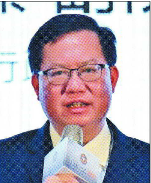
行政院副院長鄭文燦 提供

經濟日報將於3月22日舉辦2023創新論壇，以「打造綠色新經濟」為主題，邀請各界專家探討台灣如何與國際接軌，創造新價值。本論壇由經濟日報、遠傳電信主辦，中華開發金控、東元電機、長榮集團、諾基亞、聯合