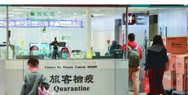
兩岸疫情平穩，有望進一步恢復兩岸航線正常運營。（本報系資料庫）

朱鳳蓮說，我們（大陸）認為，當前，大陸疫情已得到很好的控制，台灣同胞完全可以安心前來學習、工作、創業、生活。兩岸同胞對實現正常交流往來的意願強烈，我們高度重視並已全面做好相關準備。