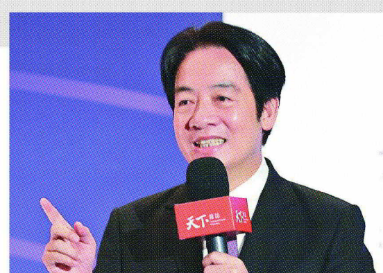
副總統賴清德

推動新南向政策，與菲律賓、越南跟印度等簽訂投資保障協定。此外，亦持續推動「台美科技貿易暨投資合作架構」(TTIC)及台美21世紀貿易倡議談判，進一步加強跟美國經貿關係。第四個挑戰就是氣候變遷。在淨零轉型過程中，台灣可以趁勢發展綠能、電力設備，或公司智慧化、低碳化，並運用人工智慧物聯網、雲端運算大數據分析等科技，「這是台灣的機會」。