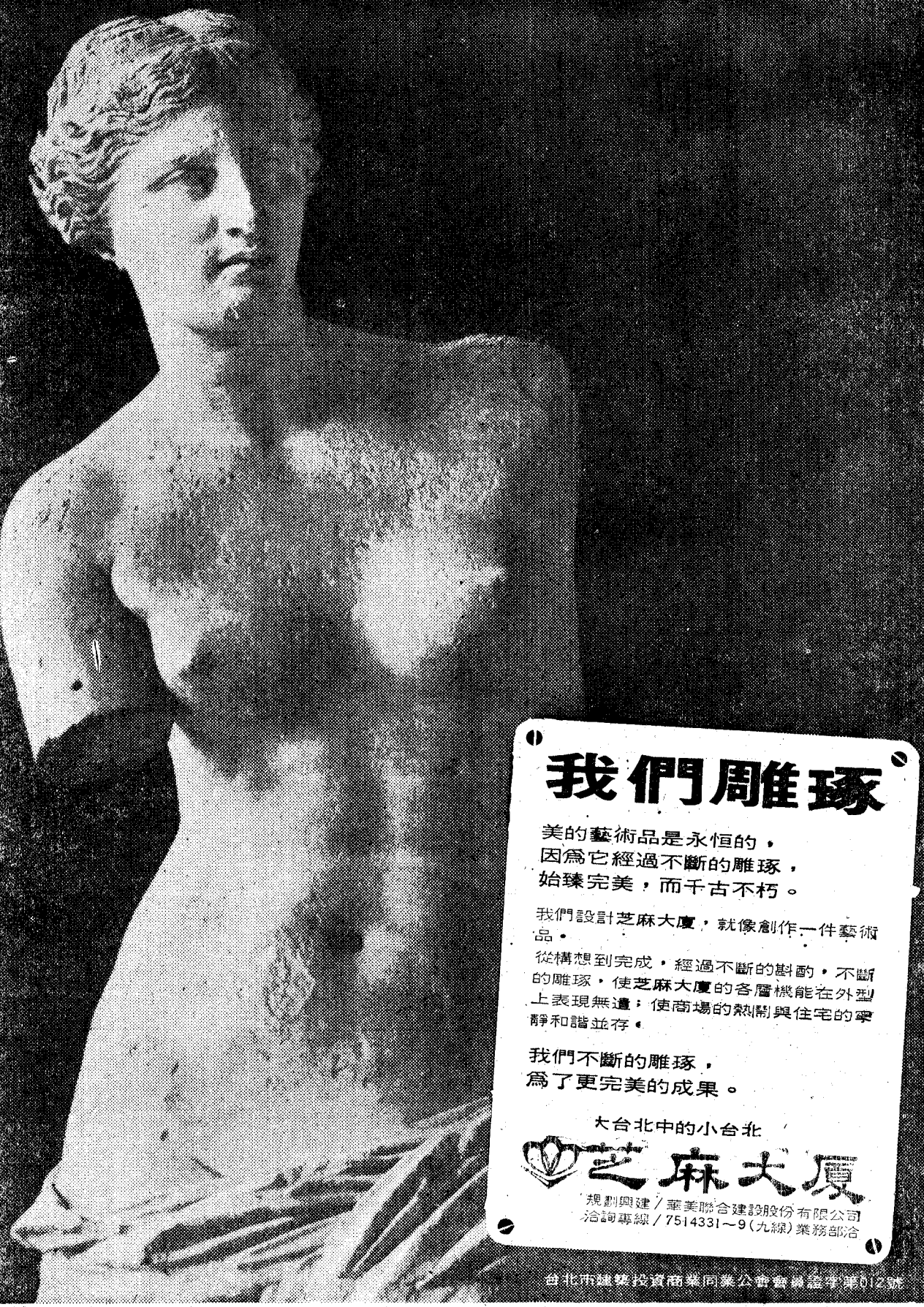
維納斯 紀元前200年作品