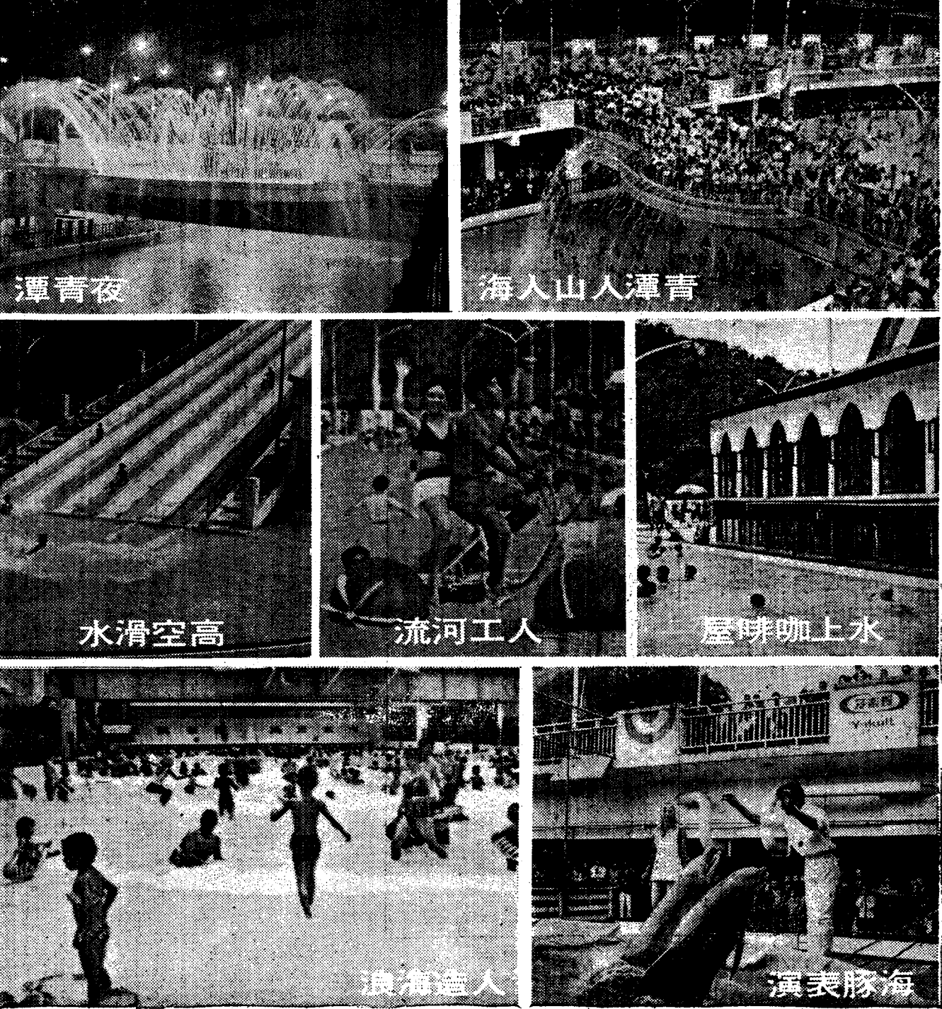
青潭立體動態游泳場徵求特定投資人要約合作啓事 本公司經經濟部核准登記設立，所經營之青潭立體動態游泳場，電子控制機械操作，計有：人造海浪、人工河流、高空滑水、人造瀑布、彩色噴泉等科學設備，並有：水上舞台、音樂餐廳、咖啡屋、旅館部等附屬設施，全部鋼筋水泥建築，立體架構，新奇宏偉，管理費用低廉，獲利能力甚高。本場自成立以來，深受各界人士之愛護，現已進入第二期工程，預計全年四季均能營業。現擬增建：「高空滑水」、「單軌飛行」、「水中之塔」、「水中之塔」、「水中之塔」等最新型之遊樂設備及設施，「青潭觀光大廈」內設：室內溫水游泳池、刀鋒溜冰場、水滑梯、安全跳傘塔、水中之塔、水中之塔等。特定之規定：依法增加資本，特將有關事項列後如次： 一、事業名稱：建康旅遊事業股份有限公司青潭立體動態游泳場。 二、擬增資金：本公司登記資本總額為新台幣參拾萬元，現已收足新台幣壹拾伍萬元，除已收新台幣壹拾伍萬元外，徵求特定投資人認購新股參拾萬元，共計認購新台幣參拾萬元，每股認購參拾股。 三、要約合作：應徵特定投資人認購新股參拾萬元，認購手續費參拾萬元，並將認購手續費匯入本公司指定之銀行帳戶。 四、認購辦法：認購手續費參拾萬元，認購手續費參拾萬元，並將認購手續費匯入本公司指定之銀行帳戶。 五、盈餘保證：由本公司原股東以新台幣參拾萬元之資金，保證各特定投資人認購新股參拾萬元，認購手續費參拾萬元。 六、長期優待：本公司訂定長期優待辦法，凡認購新股參拾萬元，認購手續費參拾萬元，認購手續費參拾萬元，認購手續費參拾萬元。 七、股票上市：本公司訂定長期優待辦法，凡認購新股參拾萬元，認購手續費參拾萬元，認購手續費參拾萬元，認購手續費參拾萬元。 八、協議限制：本公司對各特定投資人認購新股參拾萬元，認購手續費參拾萬元，認購手續費參拾萬元，認購手續費參拾萬元。 九、法定手續：由本公司委託律師辦理認購手續，認購手續費參拾萬元，認購手續費參拾萬元，認購手續費參拾萬元。 十、資料備索：本公司財務報表及第二期工程計劃，另見說明書，歡迎索閱。

茲依公司法第二六八條關於特定人之規定，要約投資人同意投資新台幣參拾萬元。業經繳交「建康旅遊事業股份有限公司」認購手續費參拾萬元。除保證甲方可得年利股息10%外，其權利義務與原股東完全相同。本協議書經甲乙雙方證明人簽章後生效。一式兩份，甲乙雙方各執一份存查。 甲乙雙方各執一份存查。 中華民國二十六年八月十八日