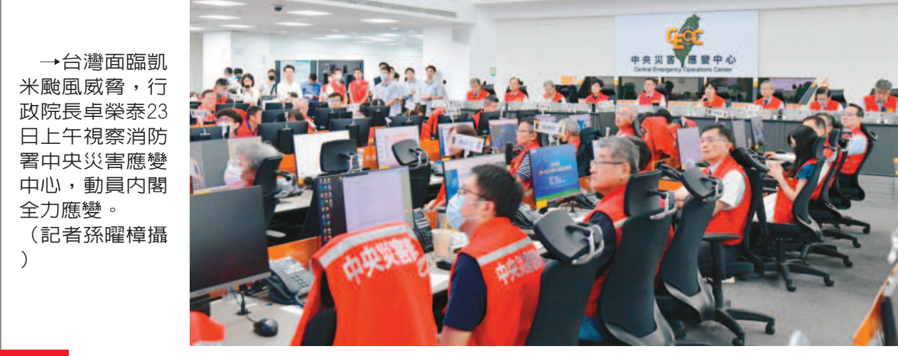
→台灣面臨凱米颱風威脅，行政院長卓榮泰23日上午視察消防署中央災害應變中心，動員內閣全力應變。

↑颱風凱米接近，又適逢年度天文大潮，23日高雄市旗津部分低窪地區發生海水倒灌情形，市場內水淹腳深。