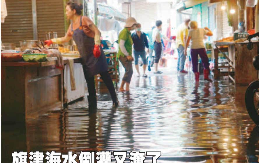
旗津海水倒灌又淹了

氣象署指出，凱米颱風二十三日晚間中心位於鵝鑾鼻的東方約三百九十里之處，以每小時十九轉十六公里速度，向西北西轉西北西方向行進，近中心最大風速每小時四十三公尺，相當於十四級風，瞬間最大陣風可達每小時五十三公尺，相當於十六級風，七級風暴風半徑二百二十公里，十級風暴風半徑七十公里。