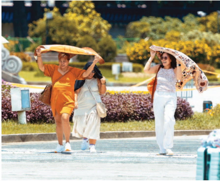
←台東金崙三十日颯四十一度，刷新今年最高溫；氣象署表示，未來一週都是高溫炎熱的天氣。圖為民眾到中正紀念堂，用披巾遮擋豔陽。

記者傅希堯／台北報導 太平洋高壓勢力持續，本週台灣地區仍將是高溫炎熱的天氣。中央氣象署指出，台東地區三十日受焚風影響，下午近二時金崙測得四十一度，打破台灣有紀錄以來歷史紀錄；但因屬自動測站，不列入正式紀錄。 根據氣象署網站，三十日台東大麻里普遍高溫都達三十八度以上，其中金崙達四十一度，暫為今年最高溫；其他包含大王村三十九點六度、香蘭村三十八點六度。 其他縣市部分，台北市士林區社子為三十九點一度、雲林縣斗南鎮三十七點三度。 根據氣象署記錄，台東十五日因焚風，鹿野的茶改場東部分場測站颯到四十點一度，大麻里也達四十度；三十日金崙四十一度再創新高。不過上述皆為自動測站，因此不列入正式紀錄。 氣象署統計，台灣有紀錄歷史最高溫出現在二〇〇四年五月九日，為四十二點一度。