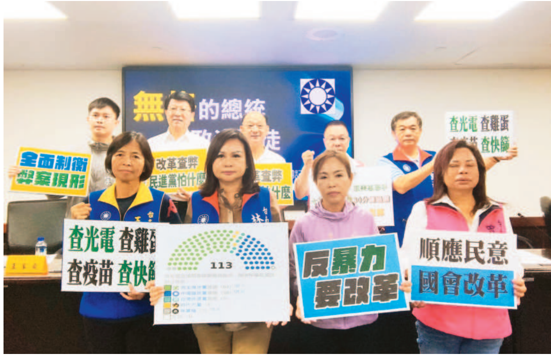
籲善意溝通 讓紛擾和平落幕

記者林雪娟/台南報導 立法院內外近日鬧得沸沸揚揚，台南市議會國民黨團二十七日(廿七)和立委謝龍介召開記者會，砲轟總統賴清德是雙標總統，黨團列舉當年種種一黨獨大時狀況，且藍白政黨所提的國會改革五法都是當年民進黨所提，如今百般阻擾，民進黨怕什麼？痛批民進黨以汙衊手法、發動年輕人方式，讓台灣的政治倒退、蒙上陰影。 近日國會改革亂象頻仍，藍營基層沸騰，要求藍軍硬起來。謝龍介和黨團召開「無格總統、政治騙徒」記者會，包括書記長許至楷、蔡育輝、王家貞、林燕祝、盧崑福、曾培雅、林美燕、蔡宗豪都出席。現場播放多段影片，包括當年七黨以人海戰術，在議會審查會、民進黨過關，如今朝小野大，改口說立法院國會改革要遵守程序正義，多位議員列舉當年種種，指賴清德不出席議會接受監督，漠視登革熱、房屋稅暴漲等，痛批賴清德根本是雙標總統。 「民進黨、賴清德怕什麼？」議員們說快節、疫苗、進口蛋、爐渣、太陽光電等案，若立委無調閱權，是否真相都被埋葬在黑暗中？民