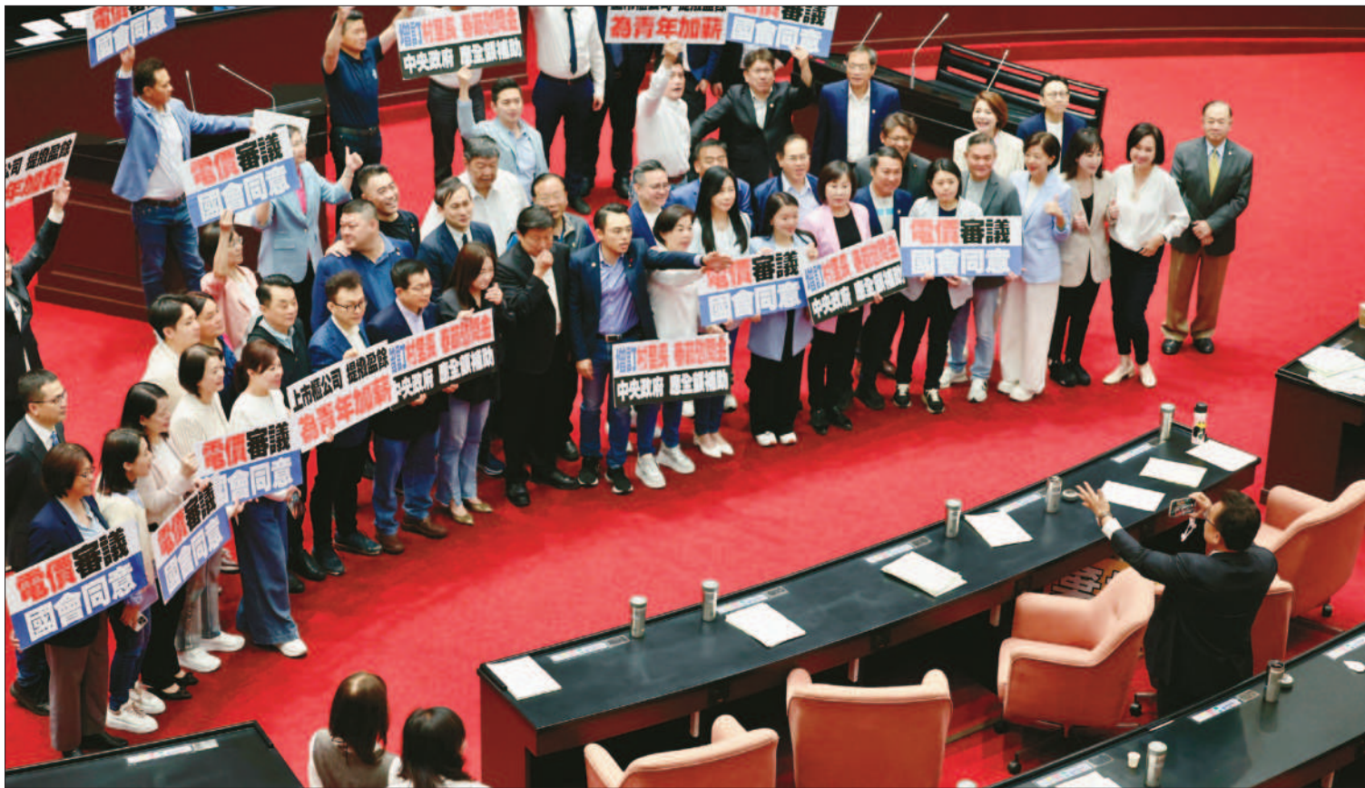
立法院會3日上演表決大戰，國民黨團要求將攸關電價調漲需求送立院同意的電業法修正案抽出逕付二讀，藍白以人數優勢通過。圖為國民黨立委拍大合照。