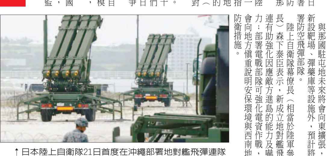
↑日本陸上自衛隊21日首度在沖繩部署地對艦飛彈連隊。圖為陸自12式陸基反艦飛彈。

本報綜合外電報導 考量台灣周邊可能出現突發事態，日本陸上自衛隊二十一日首度在沖繩部署地對艦飛彈連隊，強化日本西南地區防衛力，同時，也在距離台灣最近的與那國島上部署戰艦部隊。