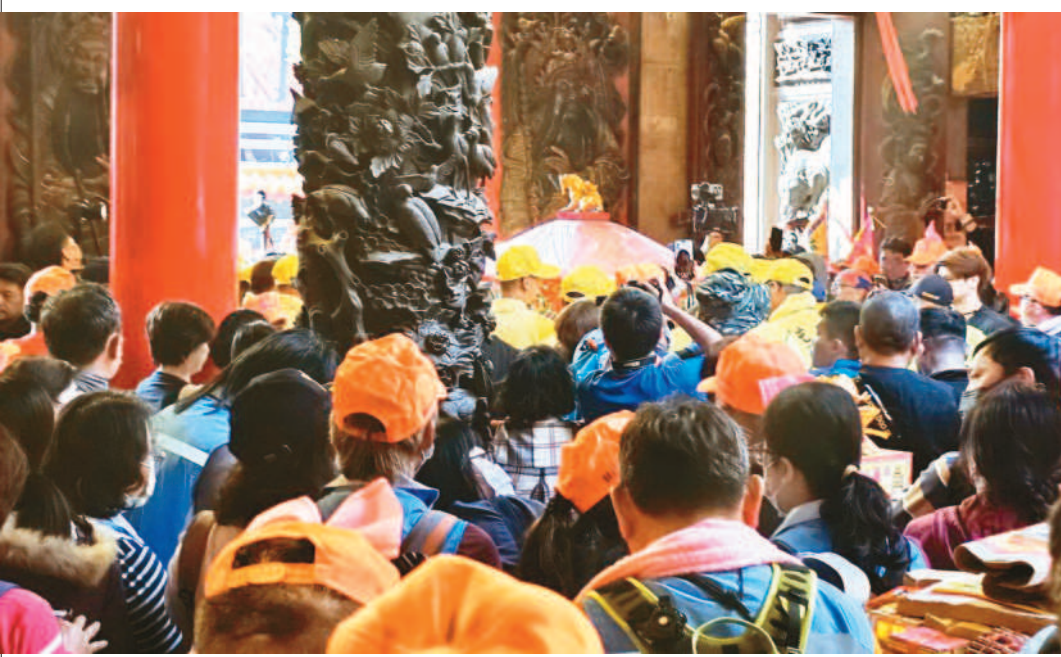
↑白沙屯媽祖十八日進香首日下午抵台中大甲，睽違十八年後再次駐駕大甲鎮瀾宮，形成罕見的「三媽會」，信眾興奮爭睹。