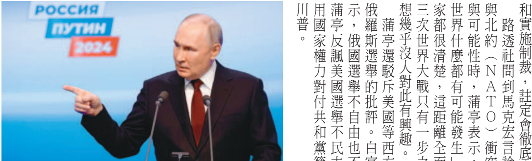
↑2024俄羅斯總統大選，蒲亭17日（當地時間）以87.8%得票率再度拿下6年任期。圖為蒲亭在投票站關閉後發表演說。

本報綜合外電報導 繼續連任的俄羅斯總統統緒蒲亭十八日表示，俄羅斯和中國的關係非常穩定，他與中國國家主席習近平的個人友誼是一份助力，還稱台灣是中國不可分割的一部分。蒲亭也警告西方，美國爲首的北大西洋公約組織若與俄國直接衝突，將意味全球距離第三次世界大戰僅一步之遙。 據央視報導，中國大陸國家主席習近平十八日致電蒲亭，祝賀他當選連任俄羅斯聯邦總統。 俄羅斯衛星通訊社報導，邁入新的六年任期的蒲亭在競選總部發表談話時說，俄中在經濟和外交政策領域都有很多契合點和共同利益。未來幾年，兩國關係將得到加強，實現共贏局面。蒲亭表示，俄中關係在過去二十年間持續穩定發展，相輔相成。他相信這種互動將持續下去，並強調「我與中華人民共和國主席的個人友誼也是一份助力」。 報導指出，蒲亭強調俄中利益吻合是國際舞台的一個穩定因素，最重要的是國家利益吻合，這爲解決國際關係領域的共同任務奠定了良好的基礎。他並說，台灣是中國的一部分。對中國的「不友好者」試圖拿台灣製造挑戰。