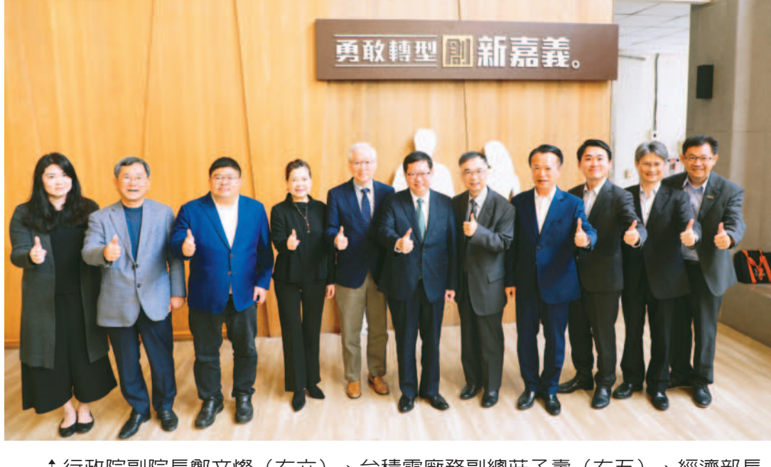
↑行政院副院長鄭文燦（右六）、台積電廠務副總莊子壽（右五）、經濟部長王美花（左四）、國科會主委吳政忠（左五）、嘉義縣長翁章梁（右四）等十八日齊聚嘉縣府，宣布台積電將在嘉科設兩座CoWoS先進封裝廠。