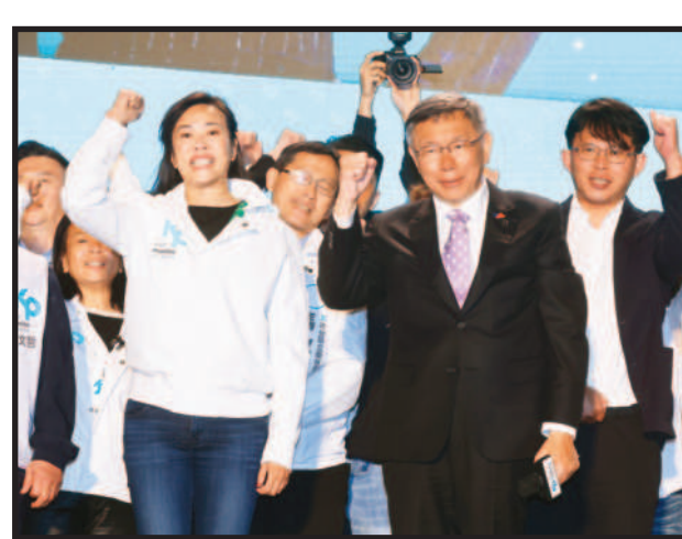
↑民眾黨正副總統候選人柯文哲(前右)、吳欣盈(前左)13日晚間在新莊競總出面宣布敗選，感謝支持者一路相挺。

記者陳柏翰／台北報導 民眾黨總統候選人柯文哲展開票結果排名第三。柯文哲表示，這是台灣第一次在藍綠高牆下，撐出了三黨鼎立的選舉局面，他向全台灣支持他的小草們預告，「四年後，我相信我們會像今天一樣，自信地把票投給柯文哲，把票投給台灣民眾黨，柯文哲不會放棄，也拜託大家不要放棄」。 民眾黨十三日下午四點起，在新莊區中華路柯盈配全國競總舉辦「公民勝利之夜」活動，許多支持者都到場一同關注看到改變的力量。 柯文哲於晚間八點左右抵達會場，表示這次選舉除了要感謝競選團隊外，也要感謝全國各地的小草們。至少成功地向世界證明，在台灣不是只有藍綠，以及民主始終是台灣最重要的資產。這次選舉證明台灣民眾黨成了一個關鍵的在野力量，也是台灣第一次在藍綠高牆下，撐出了三黨鼎立的選舉局面。這也代表台灣真的需要藍綠以外的聲音，而這個聲音將成為國家的新方向。