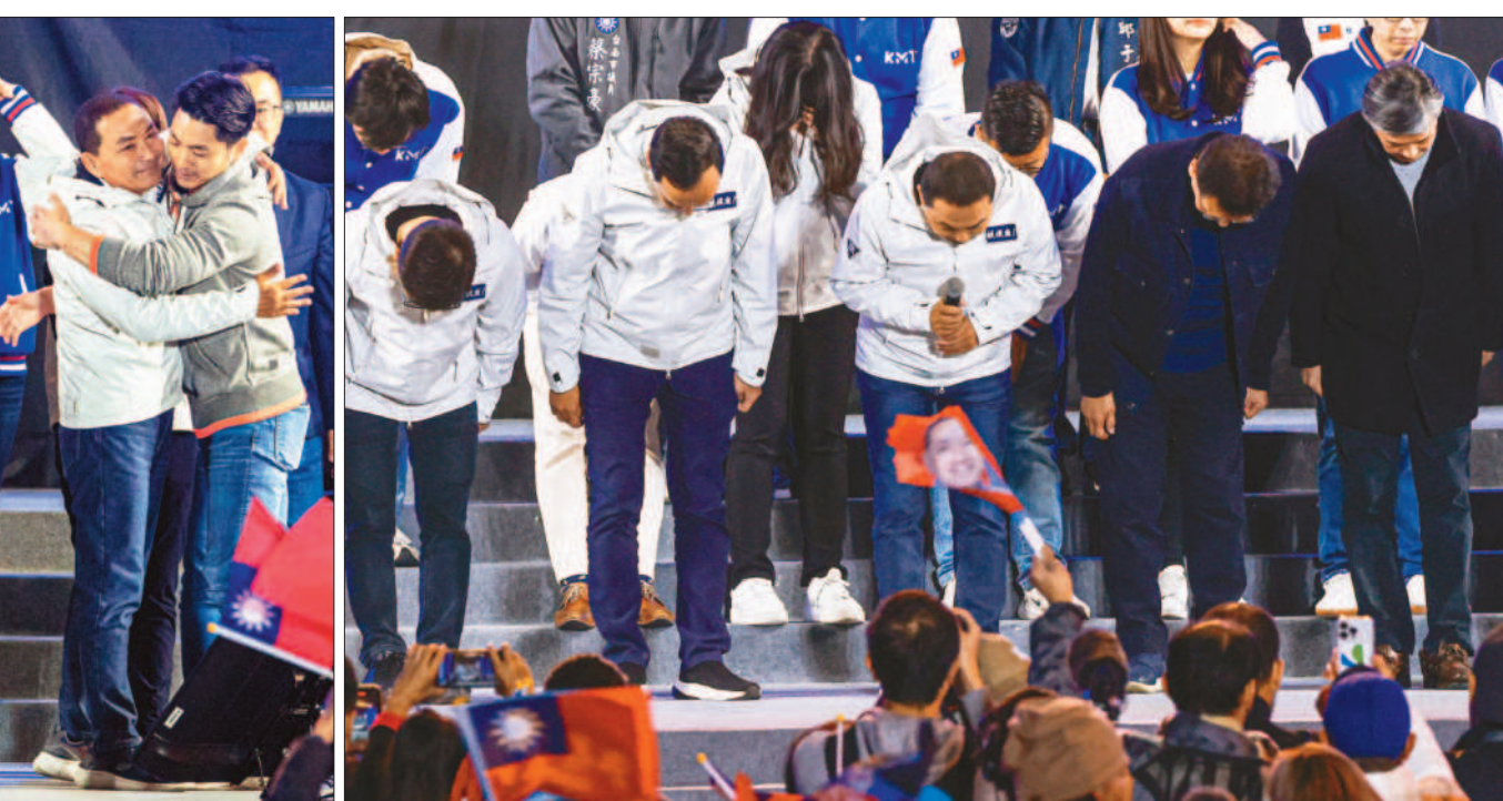
↑侯友宜宣布敗選，台北市長蔣萬安(右)到場致意，張臂擁抱。