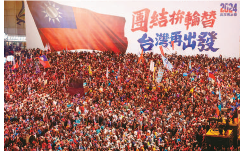
↑國民黨12日在新北市板橋第一運動場盛大舉行「贏回中華民國」選前之夜造勢活動，大批支持者揮舞國旗，高喊再出發。

記者王超群／台北報導 國民黨在總統大選投票前一天，具體提出民進黨「十大惡政」，呼籲全民若對過去八年的惡政有感，就應該「集中投藍不白投」，才能下架民進黨，呼籲在野集中力量，票投侯康，實現政黨輪替。 國民黨十二日召開「呼籲在野集中選票投侯康，實現政黨輪替！換好師傅，才有未來」記者會，競選發言人凌濤表示，賴清德說中華民國憲法是災難；民進黨執政八年斷交九國；高凌濤還表示，台灣淪為八八會館、八十八槍、掩埋爐渣之島；台灣淪為詐騙之島，到詐騙件數、詐騙金額創历史新高，人民容許嗎？此外，台灣低薪、高房價，賴清德卻說房價正在降；嘴上說要「抗中保台」，卻出現「親中麟」、「中國鵬」。 凌濤指出，蔡英文說八年要蓋二十萬戶社會住宅，卻只完工兩萬多戶；誇口不缺電，卻讓台灣大停電五次。他呼籲所有愛中華民國、愛台灣的支持者，讓下一代台灣人過更好的日子。 凌濤表示，賴清德、蔡英文的政府走在錯誤的道路上，這台車也出現很大的問題，國家機器被濫用，國民黨發布的「換好師傅，才有未來」的C/P影片在社群上引起很大的回響。完全戳破民進黨在路上的謊言，「集中投藍不白投」。