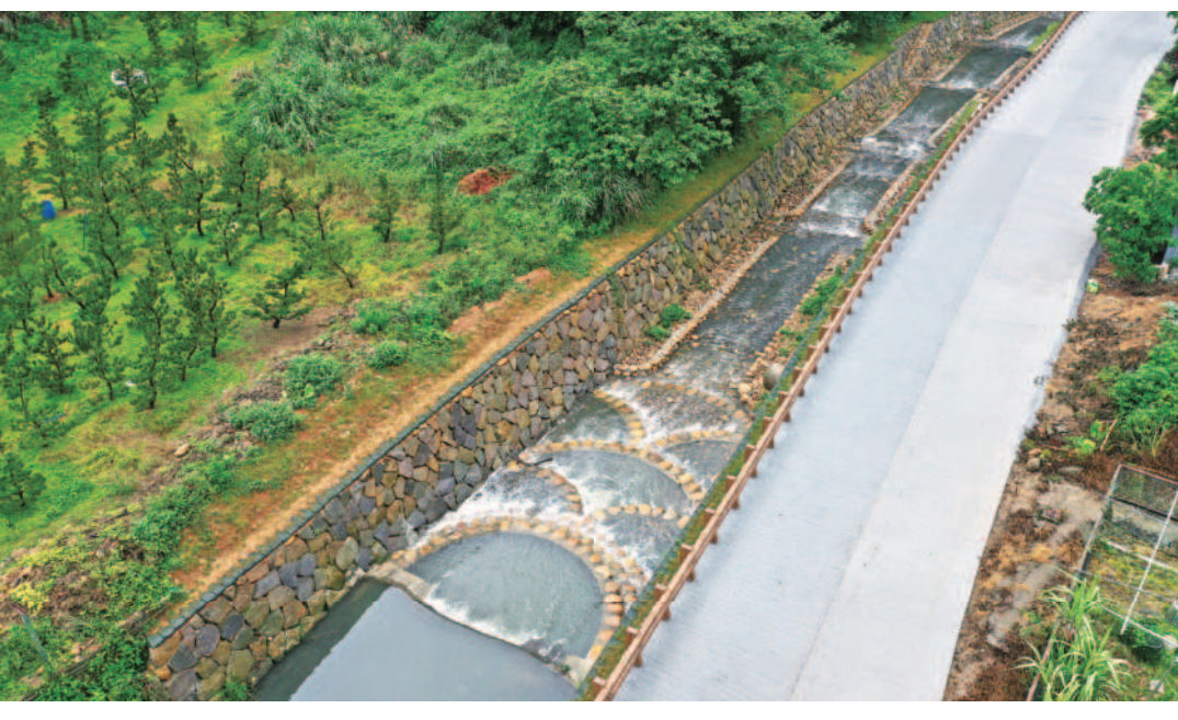
↑完工後的林口溪上游有如戴上珍珠項鍊，周遭環境美麗。