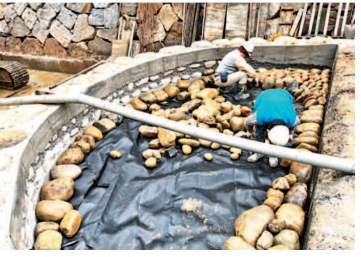
↑林口溪上游施作起始工採地工織布、卵礫石級配回填，以曝氣礫間過濾改善水質。