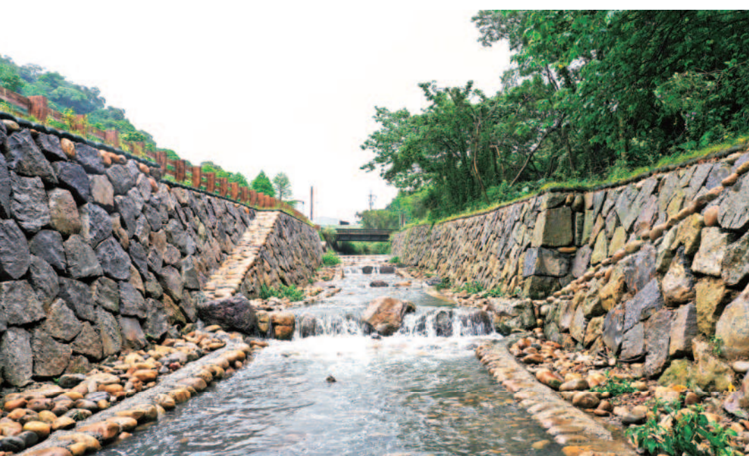
↑連續拱型漿砌石固床工，並打造生態廊道維護地方動植物生態棲息。

道路掏空，當時復建工程施工又恰於汛期，整個工期近一半的時間都在下雨，且因溪道狹小常遇溪水暴漲。為了避免後續災害擴大及工程如期如質完工，施工多在天候允許下進行，工人們常泡在溪水裡面施工，並調整施工作業流程，每日提早施工以維持進度，同時也加派機具人力，增設多個工作面同時施工。本次工程設計上採用漿砌石生態工法，減碳量達到113公噸，也營造多孔隙環境，創造多樣性生物棲息空間，施作後已見蜻蜓、溪蝦等水生動物棲息。另外將護岸改造為複式斷面，枯水期可滿足基本通洪需求並提供水生動植物環境的緩衝空間，豐水期則避免溪水暴漲造成溢流，兼顧安全與節能減碳需求。原林口溪支流因上游家庭及事業廢水導致水質不佳，為改善溪水水質與保護水生生態，在河床底層設置過濾性地工織布與卵礫石層，河川的懸浮固體由施工前35mg/L降至施工後7.9mg/L，減少近80%的懸浮固體，除了提昇環境景觀及安全，也營造生態友善環境，創造生態、防洪、景觀三贏之工程優質永續環境。 副市長劉和然表示，新北市以工程與生態環境並重為目標，以安全為前提下減少水泥使用，減少碳排放，並考量生物棲息特性，以達成安全與生態兼顧之目的，共創生態與環境的永續未來。