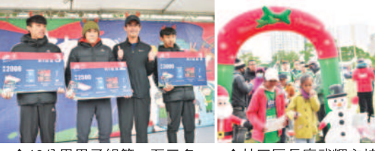
↑10公里男子組第一至三名上台領獎。