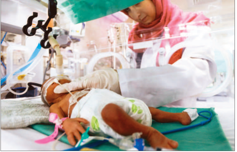
↑加薩地區燃料不足，當地醫護二十三日表示，擔憂一旦電力中斷，保溫箱中的嬰兒恐將喪命。(路透)