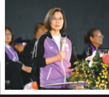
←蔡英文總統宣示112年全運會正式開始。

本報綜合外電報導 巴勒斯坦武裝團體哈瑪斯聲稱經過斡旋後，基於人道考量，二十日釋放兩名婦女權美國人質，被拒於埃及和加薩走廊拉法邊境關卡的國際人道救援組織二十輛卡車的援助物資，順利由巴勒斯坦的卡車轉運至加薩。 哈瑪斯本月七日從加薩走廊突襲血洗以色列南部社區和軍事基地，擄走約二百名人質，這對母女就是其中之一。 一名聽取過人質談判簡報的消息人士稱這對母女獲釋是「第一步」，還說釋放更多人質的相關討論正在進行中。 二十一日以色列在頭號盟友美國的要求下，同意人道救援物資經過埃及及運至加薩走廊，隨後埃及國營電視台播出的畫面可以看到多輛卡車駛入拉法邊境關卡。