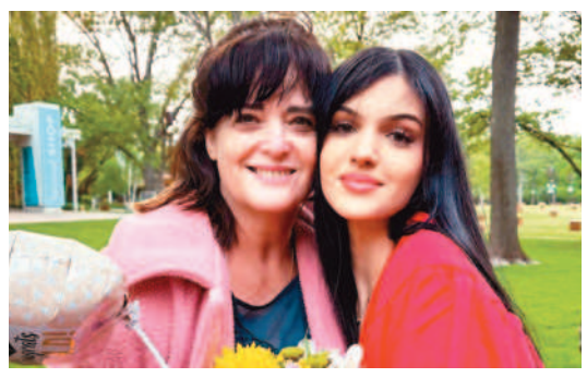
←被巴勒斯坦哈瑪斯武裝分子劫持的兩名美國母女檔在卡達的協調努力後被釋放。

載至加薩走廊援助災民。 巴勒斯坦武裝團體哈瑪斯二十日釋放的兩名美國人質，經確認為一對芝加哥母女檔，兩人均為美、以雙重國籍。哈瑪斯聲稱在卡達斡旋後，他們基於人道考量放人。 以色列總理內塔雅胡透過聲明表示，母女倆這次是在加薩走廊邊境移交給以色列部隊，「正在前往以色列中部一座軍事基地的會面點，她們的家人正在那裡等待」。 哈瑪斯本月七日從加薩走廊突襲血洗以色列南部社區和軍事基地，擄走約二百名人質，這對母女就是其中之一。 一名聽取過人質談判簡報的消息人士稱這對母女獲釋是「第一步」，還說釋放更多人質的相關討論正在進行中。 二十一日以色列在頭號盟友美國的要求下，同意人道救援物資經過埃及及運至加薩走廊，隨後埃及國營電視台播出的畫面可以看到多輛卡車駛入拉法邊境關卡。