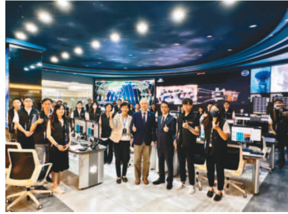
←國科會主委吳政忠、國家太空中心主任吳宗信等人到國家太空中心，勉勵將接手進行衛星操控的工程師。

記者曾芳蘭、傅希堯、康子仁／綜合報導 台灣第一顆自製氣象衛星「獵風者」九日上午九時三十分在法屬圭亞那順利升空，十時三十一分順利入軌。國科會主委吳政忠、國家太空中心主任吳宗信上午在竹科太空中心觀看直播，現場氣氛緊張，眾人屏氣凝神，最後火箭終於順利發射，太空中心響起鼓掌歡呼聲。 「獵風者」七日前因監測數據異常取消發射，歷經四十八小時排除狀況後，台灣時間九日上午九時三十分在法屬圭亞那順利升空，並於上午十時三十一分順利入軌，由國家太空中心衛星控制中心接手衛星操控。發射後一百六十三分鐘與南極地面站首次通聯，約十一個小時後(台灣時間九日晚間八點五十六分)衛星第一次通過台灣、與台灣地面站首次通聯。 國家太空中心指出，火箭發射後六分半鐘，火箭的前三節推進器便隨之脫離，第四節推進器繼續進行姿態控制；至上午十時三十分，獵風者便脫離了火箭，進入符合預定的六百零一公里高低地球軌道。 國家太空中心指出，獵風者衛星搭載台灣研發的酬載儀器「全球導航衛星系統反射訊號接收儀」，執行面風速觀測的任務。未來獵風者可補足目前較缺乏的海面風速資訊，且一天可提供近七萬筆觀測資料，與福衛七號並肩作戰，為氣候科學研究與氣象預報做出貢獻。 另外，其觀測原理較不易受雲層遮蔽影響，對於像是颱風等劇烈天氣系統預報，能提供相當寶貴的觀測資料，提升颱風強度與路徑的預報能力。 獵風者衛星包含酬載，共有約百分之八十二由台灣研發製造；若加上地面設備，有超過二十家台灣的研發單位及廠商參與。 獵風者衛星十年來歷經台美合作變更與新冠疫情，吳宗信在衛星入軌後笑說，「好酒沉甕底」，實在不容易。獵風者升空後，意味台灣自主研發的關鍵元件「真的飛過了」，將取得太空飛行履歷，助攻廠商打入國際航太供應鏈。 總統蔡英文九日也在臉書發文表示，獵風者從構想、設計到製作都是「台灣製造」；未來政府也將透過第三期太空計畫，於十年內投入二百五十億元，與民間共同推動太空產業鏈發展，同時培育太空科技人才。她強調，「台灣在太空的新興場域不會缺席」。 行政院長陳建仁也在臉書發文指出，獵風者將持續提供劇烈天氣預報等珍貴觀測資料；這也是首次和歐洲載具廠商合作，對未來台灣自行建置發射場很有幫助。