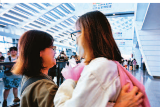
↑哈瑪斯七日對以色列發動突襲，部分停留當地的台灣旅遊團九日返台，一名媽媽與親友帶著鮮花到機場接機，懸著的心直到班機落地才放下。

本報綜合外電報導 巴勒斯坦伊斯蘭激進運動組織「哈瑪斯」集團七日從海陸空三路突襲以色列，與以色列爆發五十年來最嚴重衝突。聯合國安理會九日針對這場危機召開緊急會議，美國率先呼籲譴責恐怖主義行徑，以色列大使表示是時候摧毀哈瑪斯了，但安理會並未全體一致譴責，美國對此表示遺憾。 有伊朗撐腰的哈瑪斯七日自加薩走廊對以色列發動突襲，發射數千枚火箭並進入以國境內挾持逾百名軍民人質，雙方死亡人數總和至少超過一千一百人；以色列內閣八日通過正式向哈瑪斯宣戰，五十年來首度進入戰爭狀態，國防部表示，這是以色列的9.11事件，並展開「鐵劍行動」大規模還擊，轟炸哈瑪斯掌管的加薩走廊超過五百個哈瑪斯據點，並宣布已掌控加薩走廊附近的以色列南部社區。 以色列國防部長葛朗特下令對加薩實施「全面圍困」，能源部長卡茲隨後下令切斷對加薩的供水。國防軍發言人並宣布，哈瑪斯發動突襲的指揮官辛瓦已身亡。 安理會輪值主席國巴西針對哈瑪斯突襲事件召開緊急會議。以色列大使出示該國公民遭到哈瑪斯俘虜的圖片說：「這些都是戰爭罪行，明目張膽，有證據的戰罪，必須對這種難以想像的暴行予以譴責。必須給予以色列堅定支持來進行自我保護，保護自由世界。」 巴勒斯坦駐聯合國大使曼蘇爾呼籲安理會聚首在結束以色列占領。他代表約旦河西岸的巴勒斯坦自治政府，而非敵對的哈瑪斯。安理會多個成員國譴責哈瑪斯對以色列發動大規模突襲，由於非全體一致譴責，美國對此表示遺憾。在安理會大致和俄羅斯站一邊的中國大陸，這次表示會支持安理會發布聯合聲明。 白宮指出，美國總統拜登已經下令對以色列提供「額外支持」。國防部已下令美國最先進核子動力航母福特號打擊群航向地中海，做好協助以色列的準備。 英國首相蘇納克也與以國總理內坦雅胡通話，重申英國將堅定明確與以色列一同對抗恐怖行動，提供以方所需「任何支援」。伊朗駐聯合國代表團表示，伊朗並未參與哈瑪斯這次突襲。