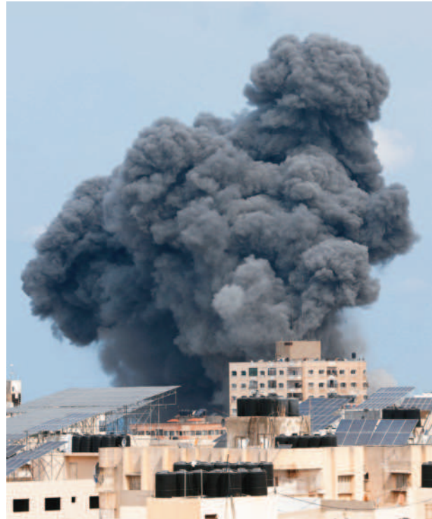
↑以色列九日展開鐵劍行動，轟炸加薩。→加薩走廊北部賈巴利亞難民營，民眾抬著在以色列攻擊行動中喪生的巴勒斯坦人屍體。