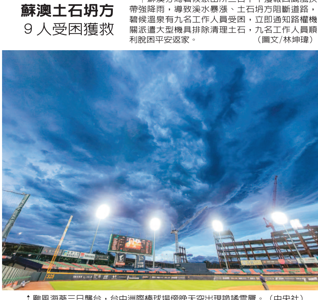
↑颱風海葵三日襲台，台中洲際棒球場傍晚天空出現詭譎雲層。