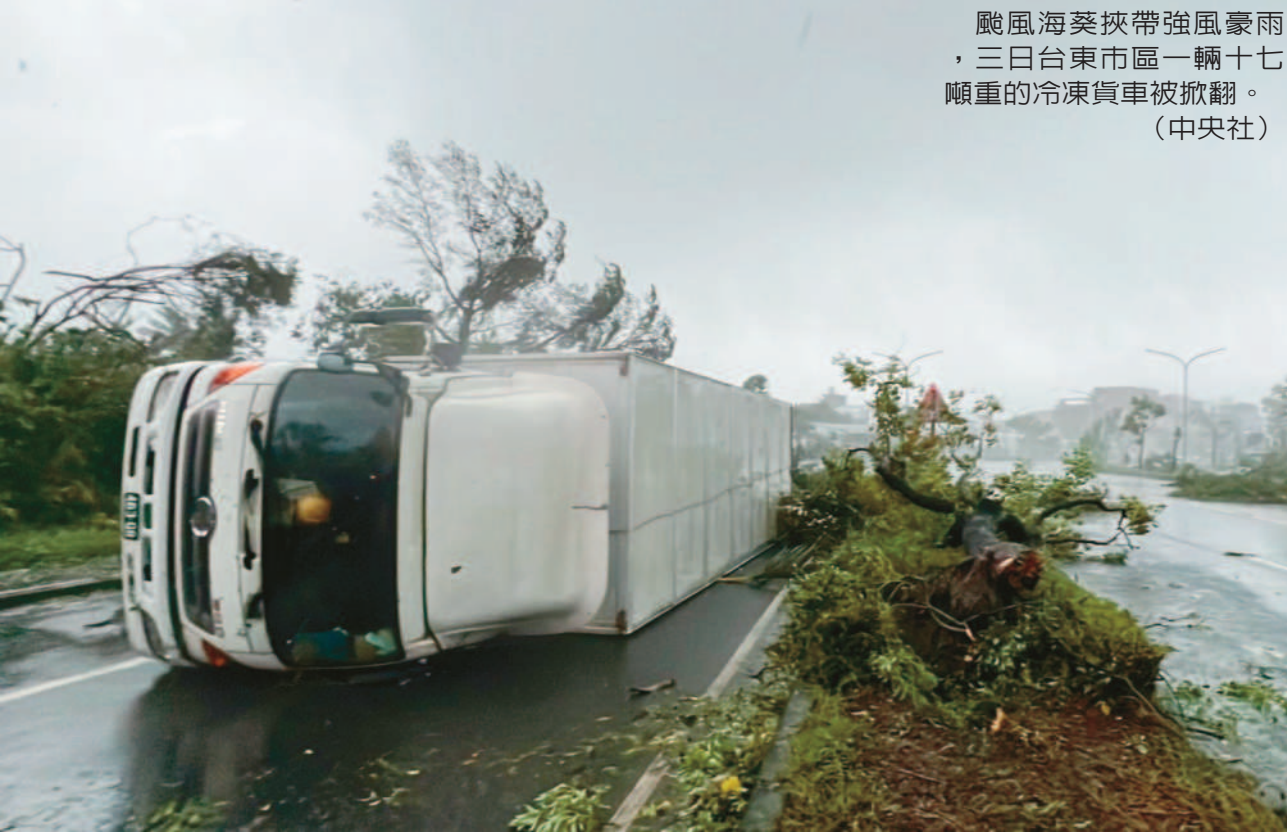
颱風海葵挾帶強風豪雨，三日台東市區一輛十七噸重的冷凍貨車被掀翻。