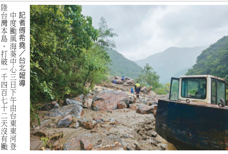
↑蘇澳分局碧候派出所三日下午獲報因颶風挾帶強降雨，導致溪水暴漲、土石坍方阻斷道路，碧候溫泉有九名工作人員受困，立即通知路權機關派遣大型機具排除清理土石，九名工作人員順利脫困平安返家。

記者傅希堯／台北報導 中度颱風海葵中心三日下午由台東東河登陸台灣本島，打破一千四百七十二天沒有颱風登陸的紀錄。晚間颶風中心從高雄梓官進入台灣海峽，東半部強風、豪雨持續，中南部風雨逐漸增強。 中央氣象局持續發布海葵海上陸上颶風警報，暴風圈在清晨五時觸陸，中心下午三時許在台東東河登陸，成為四年多來首個中心登台的颱風。台東地區風強雨驟，更出現十六級強陣風，不少路樹、商家招牌等遭強風吹落，街道一片狼藉。台東市區一輛十七噸重的冷凍貨車甚至被掀翻。 海葵登陸後強度略減弱，但仍是中度颱風；翻過中央山脈後，晚間八時許中心從高雄梓官出海。高雄市晚間風雨明顯增強，六龜區、三民區陸續出現樹倒狀況，六龜出現輕微土石流，所幸無人受傷；街上有民衆撐不住傘大喊「這風好可怕」。 隨著海葵往西移動，中南部風雨逐漸增強，四、五日持續影響台灣。颶風進入台灣海峽後，澎湖及金門的風雨也變得明顯。 氣象局預報員劉宇其表示，海葵進入台灣海峽速度有放緩的跡象，四日晚間台灣有機會脫離暴風圈。考慮到澎湖的影響，解除陸警預估是五日上午、深夜解除海警，但後續仍有不確定性。 總統蔡英文三日由行政院長陳建仁陪同，前往中央災害應變中心，並慰勉自杜蘇芮颶風以來接連幾個颱風協助防災的警消人員、國軍弟兄，及維持供水、供電等民生穩定的工作夥伴。蔡英文指出，海葵路徑仍存在不確定性，各單位嚴陣以待，啟動各項防範應變工作，也密切關注各地狀況。 受到颶風持續影響多個縣市宣布四日停班、停課，包括台中、彰化、南投、雲林、嘉義縣市、台南、高雄、屏東、花蓮、台東、澎湖、連江、金門等，新竹縣尖石鄉玉峰村、秀巒村也停止上班、上課。 (相關新聞刊A5)