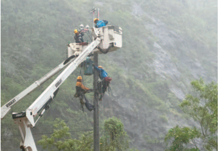
←南橫公路持續出現多處邊坡坍方，土石掉落影響搶修進度，避免危險民眾勿上山。(記者鄭錦晴翻攝) ↑杜蘇芮颱風陸續傳出停電災情，台電投入大量人力搶修，山區道路中斷用戶復電速度較慢。(記者鄭錦晴翻攝)